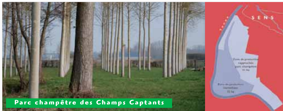
Parc champêtre des Champs Captants

L'eau potable pompée dans la plaine Chambertrand est une des meilleures distribuée dans l'agglomération sénonaise. Analysée régulièrement, elle est très peu nitratée (moins de 20 milligrammes par litre). Elle n'a