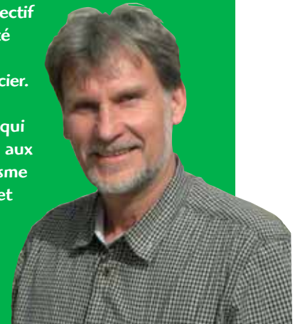
GILLES MILLÈS Vice-président chargé de l'Action Economique

Cette étude a pour objectif de juger de la faisabilité de la zone en termes topographique et financier. Elle vise à établir des plans d'aménagement qui seront ensuite intégrés aux Plans Locaux d'Urbanisme (PLU) des communes et permettra à la CCS d'exercer le droit de préemption urbain afin de se porter acquéreur des terrains mis en vente dans les secteurs concernés.